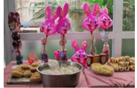
Mesa repleta de gostosuras para comemorar a Páscoa em grande estilo.

Para completar, a culinária Rita, com a ajuda das mães/acompanhantes e de alguns adolescentes, preparou lanches, docinhos e um lindo bolo.