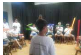
Apresentação musical na Fundação Gol de Letra.

A troca entre a equipe de educação da associação e a Fundação Gol de Letra foi muito positiva e sugeriu novas possibilidades para o trabalho Pedagógico da ACTC.