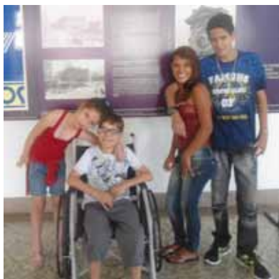
Adolescentes visitam a exposição do artista plástico Yutaka Toyota, "Sim, pode tocar!"

Uma lembrança foi desenvolvida pelo grupo em duas oficinas coletivas realizadas na Sede e na Unidade II. As atividades práticas, nas quais jovens e crianças criam e interagem sempre são elementos de ganhos para ambos os lados; são oportunidades para que os menores convivam com os adolescentes e possam ter uma noção de futuro e para que os jovens saiam de seus mundos internos e tenham a chance de cuidar dos pequeninos e auxiliá-los numa meta comum. Desta forma, as educadoras propuseram uma oficina que contemplasse ambas as necessidades: de grandes e de pequenos. Pintura, sabonetes e forração com papel de folha de bananeira foram unidos na criação de uma lembrancinha que ficou um charme: uma caixinha em MDF, pintada por eles, contendo uma toalhinha de mão e dois sabonetes. Os trabalhos feitos despertaram a criatividade de cada um e ficaram lindos! Este foi o presente que cada mãe recebeu.