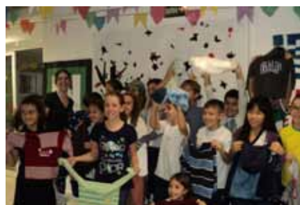
A turma de ensino fundamental entregou pessoalmente as doações.

Cumprimentamos a todos pela iniciativa e agradecemos o apoio.