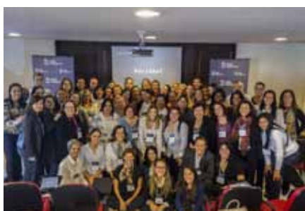
Representantes da FAH e das organizações no 1º Workshop.

Parceria criará novas oportunidades para a ACTC – Casa do Coração