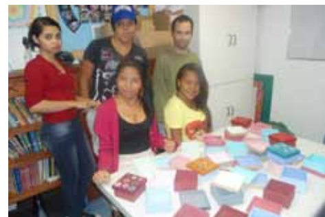
Oficinas realizadas para a produção das lembrancinhas do Dia das Mães.