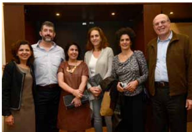
Crianças, adolescentes, mães/acompanhantes (esq.) e diretoria (dir.) da ACTC - Casa do Coração prestigiam o primeiro espetáculo do Projeto “Concertos Brasileiros”.

No dia 20 de maio a ACTC – Casa do Coração apresentou o primeiro espetáculo da série Concertos Brasileiros, que prevê três apresentações musicais de artistas consagrados em diferentes estilos do repertório nacional. A série vai propiciar, por meio de sua receita, o subsídio de parte das despesas da instituição, possibilitando a viabilidade da permanência dos seus assistidos, durante o período de permanência em São Paulo.