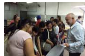
Crianças e adolescentes da ACTC - Casa do Coração são recebidos pela equipe da Gráfica Sonora.