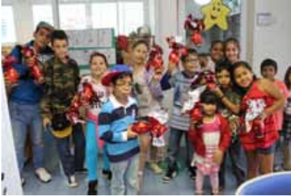
Crianças e adolescentes recebem os Ovos de Páscoas doados pelos parceiros da ACTC - Casa do Coração.

Festa contou com a contribuição de parceiros, que doaram os ovos para as crianças e os adolescentes